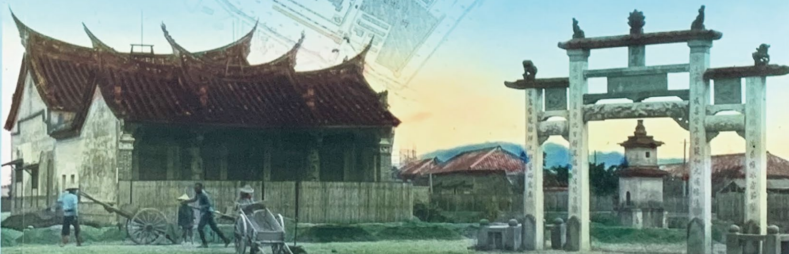
▲ 即將拆除興建今臺灣博物館的天后宮・前方為石坊街的急公好義坊 (Mary Schäffer 1908)