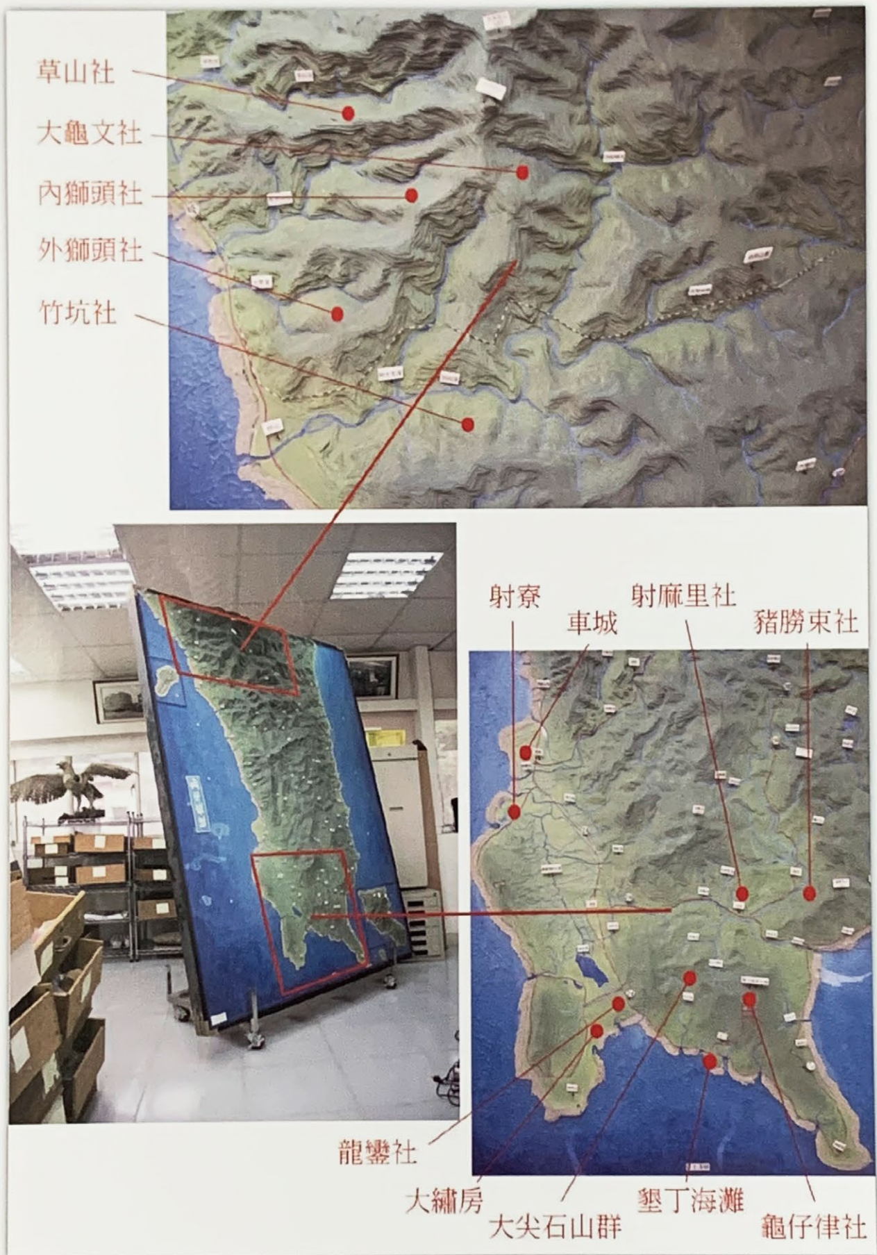
▲ 圖 5：恆春半島立體地形圖（兩萬五千分之一） 上→清淮軍與大龜文社群部落血戰百日之戰場所在範圍 下→含美國羅妹號 (Rover) 船難者受害處，美國海軍陸戰隊登入點及李仙得將軍與大酋長卓杞篤談判、折衝過程之諸地點