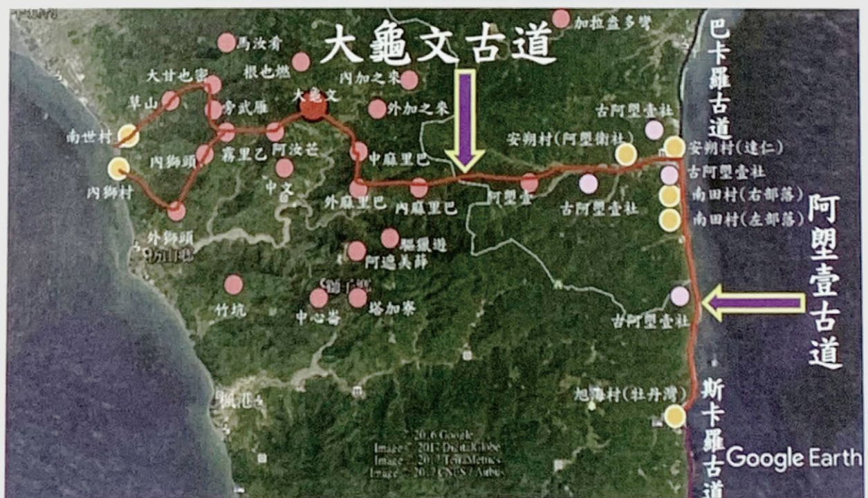
▲ 圖 4：潘志華繪 1875 年左右的大龜文酋邦地域圖