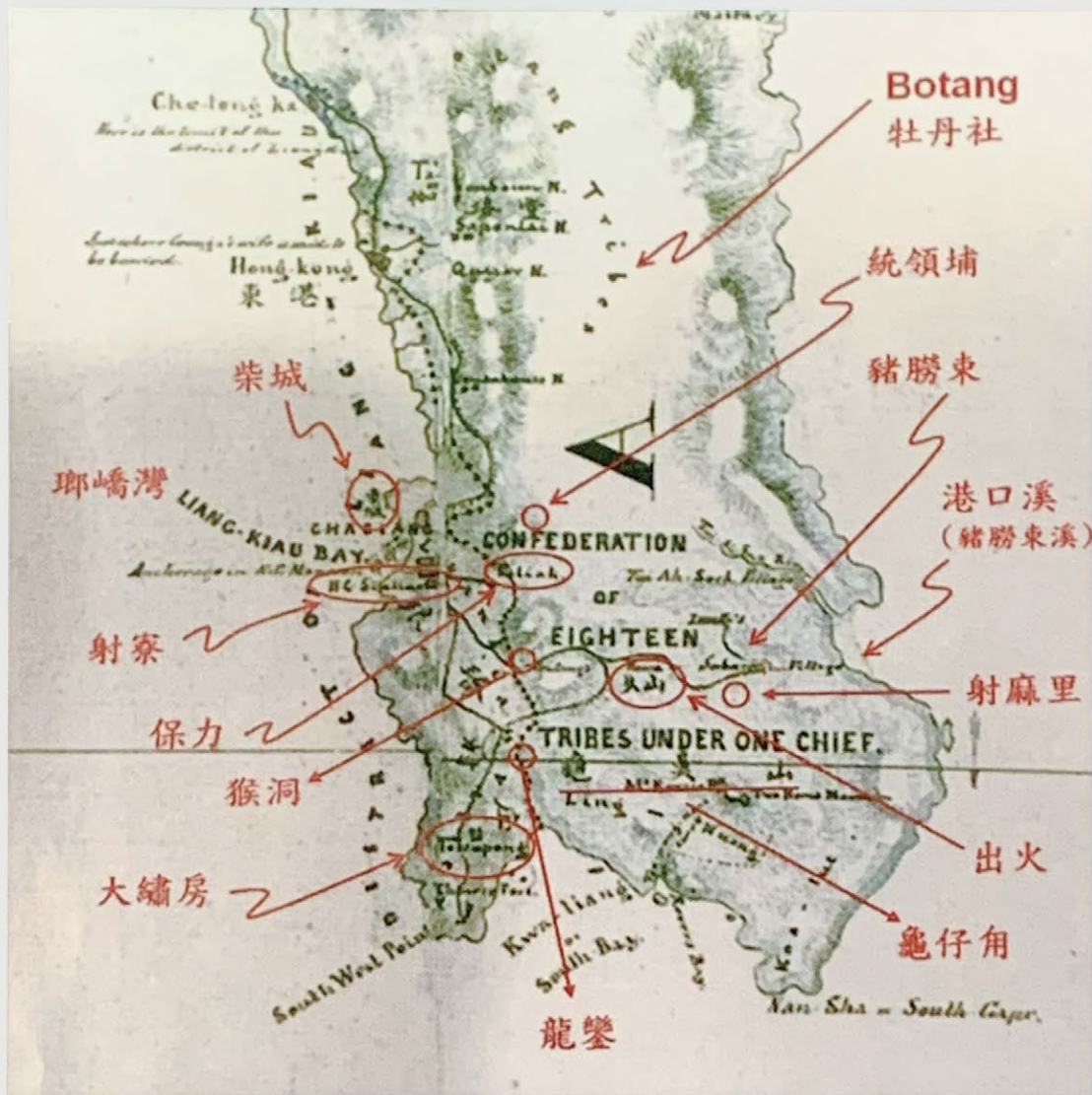
▲ 圖 2：李仙得繪，瑯嶠地圖（約 1870 年左右之恆春半島）